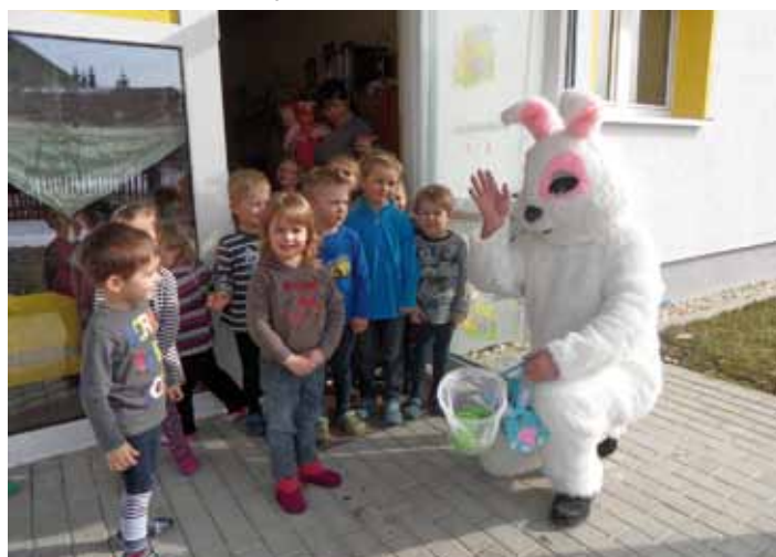
Die Kinder der Kita „Am Ententeich“ mit ihren Erziehern und Erzieherinnen

Im Rahmen der Osterzeit veranstaltete die Spatzengruppe eine Projektwoche zum Thema „Auf der Suche nach dem Osterhase“. Höhepunkte dieser Woche war zum Einen der Besuch eines richtigen Kaninchens in der Kindertagesstätte. Vom Besitzer des kleinen Mümmelmanns erfuhren die Kinder und auch die Erzieher viel Wissenswertes über Kaninchen. Voller Spannung verfolgten die Kleinen den Bericht über die neugeborenen Jungtiere und so manch einer wunderte sich darüber, dass Bananenschalen zum Leibgericht unseres tierischen Besuchs zählen. Die Projektwoche wurde perfekt, als dann auch noch der richtige Osterhase um die Einrichtung hoppelte. Wir hatten richtig Glück, denn nachdem der Osterhase ein Osterlied von den Kindern gehört hatte, durfte er sogar gestreichelt werden. So gut hat ihm das Lied gefallen! Am 20.04.2013 fand dann wieder unsere jährliche Putzaktion auf dem Kita-Gelände statt. An dieser Stelle vielen Dank an alle Helfer, die unsere Osterwoche so spannend gestaltet haben und an alle fleißigen „Putzteufelchen“, denen wir unseren sauberen Kita-Garten zu verdanken haben. Wir freuen uns schon auf unsere nächsten großen Veranstaltungen im Juni, wie z.B. das schon zur Tradition gewordene Kinderfest am 08.06.2013 auf dem Sportplatz in Bergen und unsere große Projektwoche „Gesundes Essen“ mit dem Sodexo-Korbtheater und dem Stück „Paule kommt auf den Geschmack“ inklusive einem großem Buffet mit zwei richtigen Köchen. Aber davon können wir ja dann im nächsten Amtsblatt berichten.